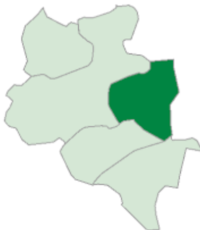
Rysunek 1. Mapa Gminy Domaszowice

Gmina Domaszowice zajmuje obszar 113,9 km 2 . Według danych GUS Gmina liczy 3.571 mieszkańców, a gęstość zaludnienia to w przybliżeniu 31,9 osoby/km 2 .